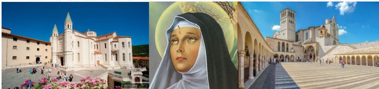
Assisi-Basilica di San Francesco