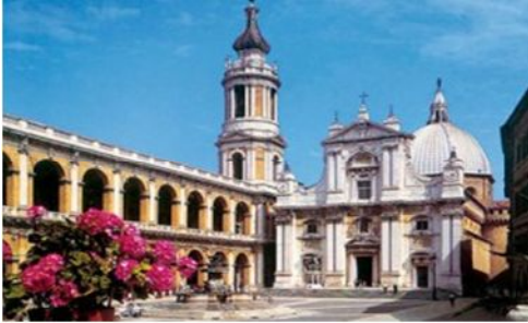
Basilica di Loreto