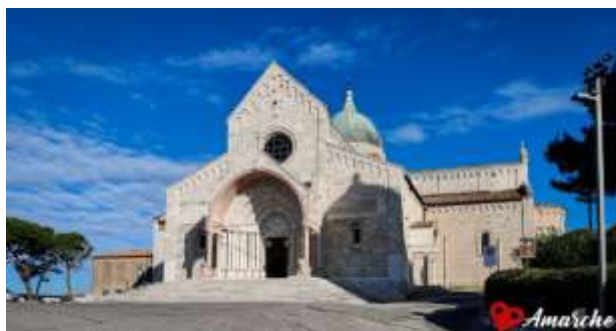
Duomo di S. Ciriaco- Ancona