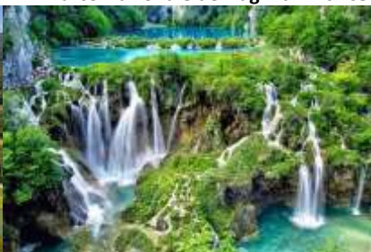
Parco Nazionale dei Laghi di Plitvice