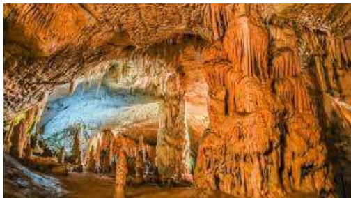
Grotte di Postumia